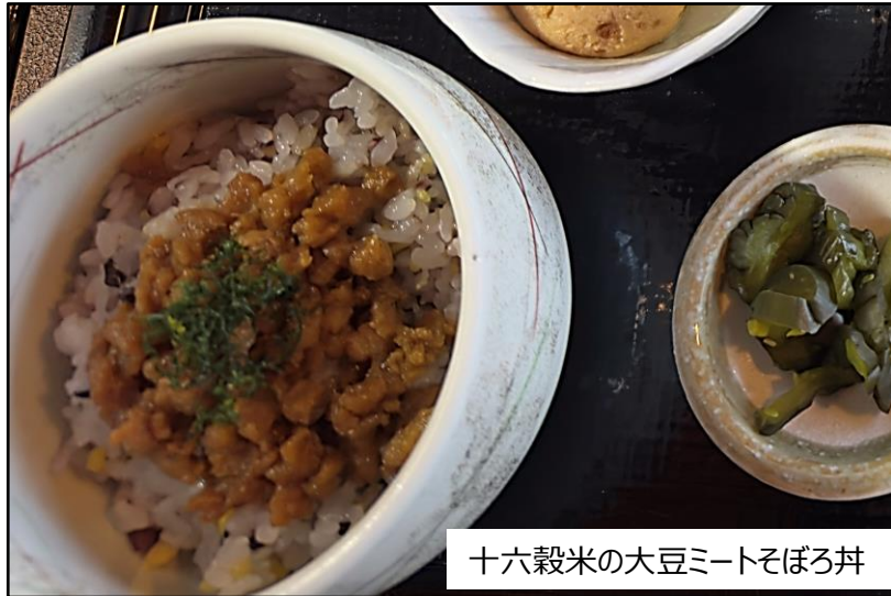
十六穀米の大豆ミートそぼろ丼

ネームリストにてお知らせいただけたら、非常に助かります。その際、席割り（グループ毎）させていただきます。