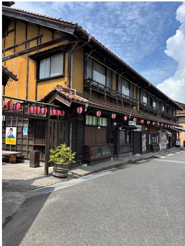
神楽門前湯治村の外観イメージ 村のあちこちに昔の田舎の風物詩があり、フोटスポットとしても人気です。