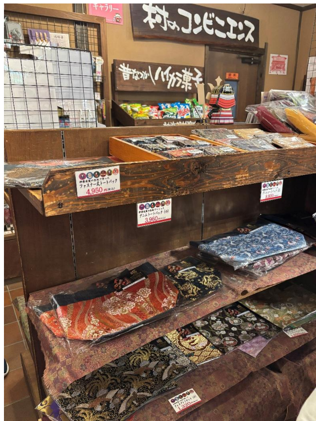
お土産物店内（神楽関連グッズ、駄菓子などを販売）