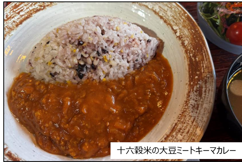
十六穀米の大豆ミートキーマカレー