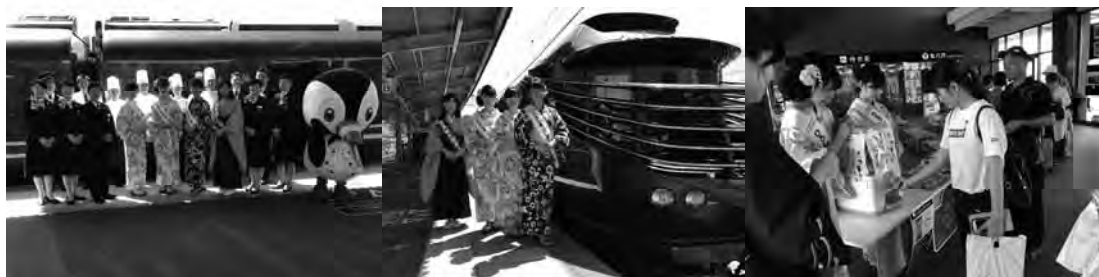
(瑞風立寄り一周年記念 浴衣姿でお出迎え 宮島口駅)