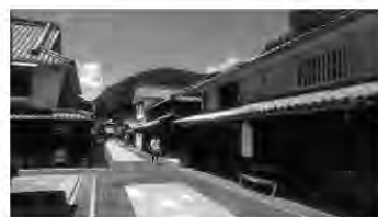
竹原町並み保存地区 ほとんどの施設、店舗が通常どお