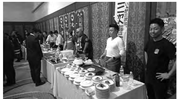
左上：全体説明会，右上：個別商談会，下4点：交流会（グルメブース）