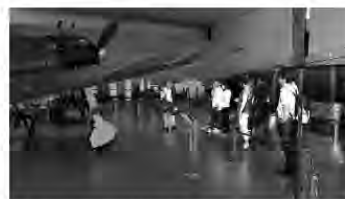
大和ミュージアム(2018年8月8日)

7月11日から開館しています。開館時間も8月20日より通常の9:00~18:00となりました。