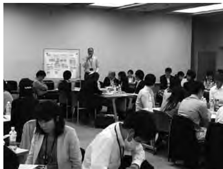
グループ討議（発表）