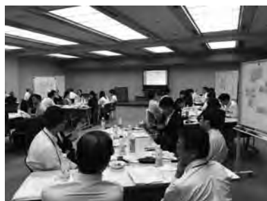
グループ討議の様子