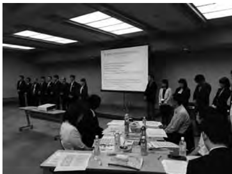
旅行会社・アドバイザー紹介