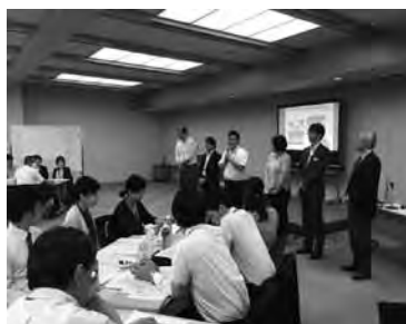
旅行会社・アドバイザー紹介