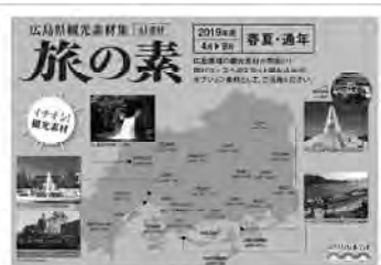
（旅の素：2019 年度上期用）

「旅の素」の市町毎の観光素材を一冊、各種素材を一冊にまとめて製本し、旅行会社に配布（観光情報説明会・キャラバンなど）