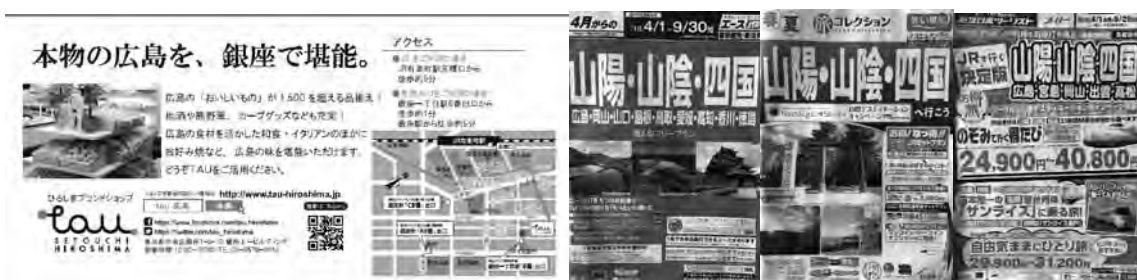
（旅行会社掲載誌面の一例）