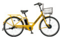
電動アシスト自転車